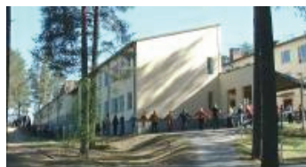
□ Laukaan koulu ja lukio.

Laukaa sijaitsee runsaat 20 km Jyväskylästä pohjoiseen. Sydän-Laukaan koulu ja lukio sekä niiden yhteydessä oleva liikuntahalli muodostavat tässä kuussa valtakunnallisen Kristus-juhlan pitopaikan. Koulu ja liikuntahalli ovat lähellä Laukaan keskustaa, os. Saralinnantie 3. Tilaisuudet pidetään liikuntahallissa. Ruokailut ovat salin yhteydessä olevassa koulun ruokailusalissa.